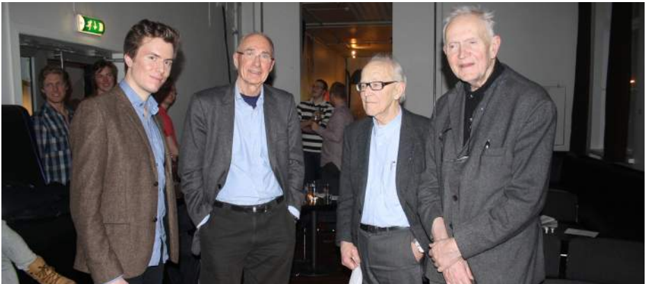
Fra venstre: H.H. Silly Walk, H.H. Dykkanden, H.H. Trebinderen og H.H. Sengevarmeren.

Hvordan historien går videre vil bli tema for en ny historisk aften senere i vår, og selvsagt for boken som gis ut i forbindelse med 100-årsfeiringen neste år.